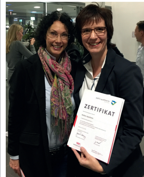
Überreichung der AMTS-Zertifikate der Apothekerkammer Westfalen-Lippe

Es ist Ihr Arzt, der bedarfsorientiert ein Medikament verordnet, das dann mittels eines Rezeptes von Ihnen selbst in der Apotheke abgeholt wird. Doch bei aller Sorgfalt und Genauigkeit kann es, besonders wenn viele Medikamente eingenommen werden müssen, zu Medikationsfehlern kommen. So gibt es Medikamente, die sich gegenseitig ausschließen oder deren gemeinsame Anwendung keinen Sinn ergeben oder vielleicht gefährlich ist. Oft ist das nicht gleich erkennbar.