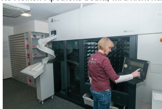
Moderne Technik hilft uns bei der täglichen Arbeit

60 Jahre Nelken-Apotheke. Eine lange Zeit mit vielen Veränderungen, die ohne unsere Kunden nicht möglich gewesen wären.