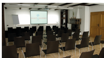
Im Mai 2010 wurde die Nelken-Akademie eröffnet

Die erste Offizin der Nelken-Apotheke aus dunklem Holz im Jahr 1957 war charakteristisch für die damaligen Apotheken. Die typische Freiwahl, aus der Kunden selbst Gesundheits- und Pflegeprodukte auswählen konnten, gab es kaum. Auch die Herstellung von Medikamenten spielte eine weit größere Rolle als heute. Das und vieles andere änderte sich im Laufe der Zeit.