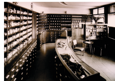
Die Offizin im Jahr 1957